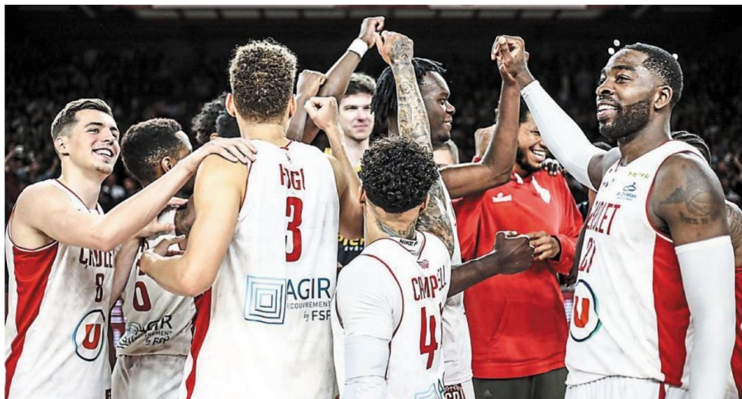
Le collectif de Cholet Basket est prêt à tout pour retrouver les playoffs, dix ans après.