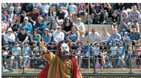
Le Signe du Triomphe dans le stadium gallo-romain du Puy du Fou.