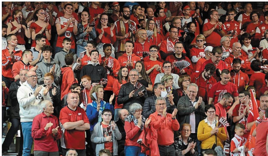
Porté par une Meilleraie chauffée à blanc, Cholet Basket a arraché son ticket pour les playoffs.