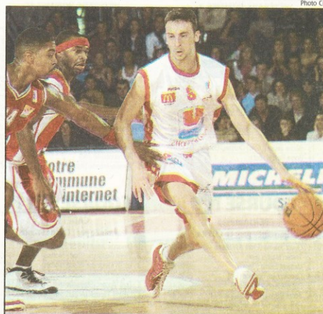
FL Ferchaud et les Choletais ont un bon coup à jouer ce soir à Rouen

« Attention, nous ne sommes pas non plus très bien au classement et Rouen, à domicile, va se défendre » dit toutefois l'entraîneur choletais pour prévenir tout excès de confiance de ses protégés.