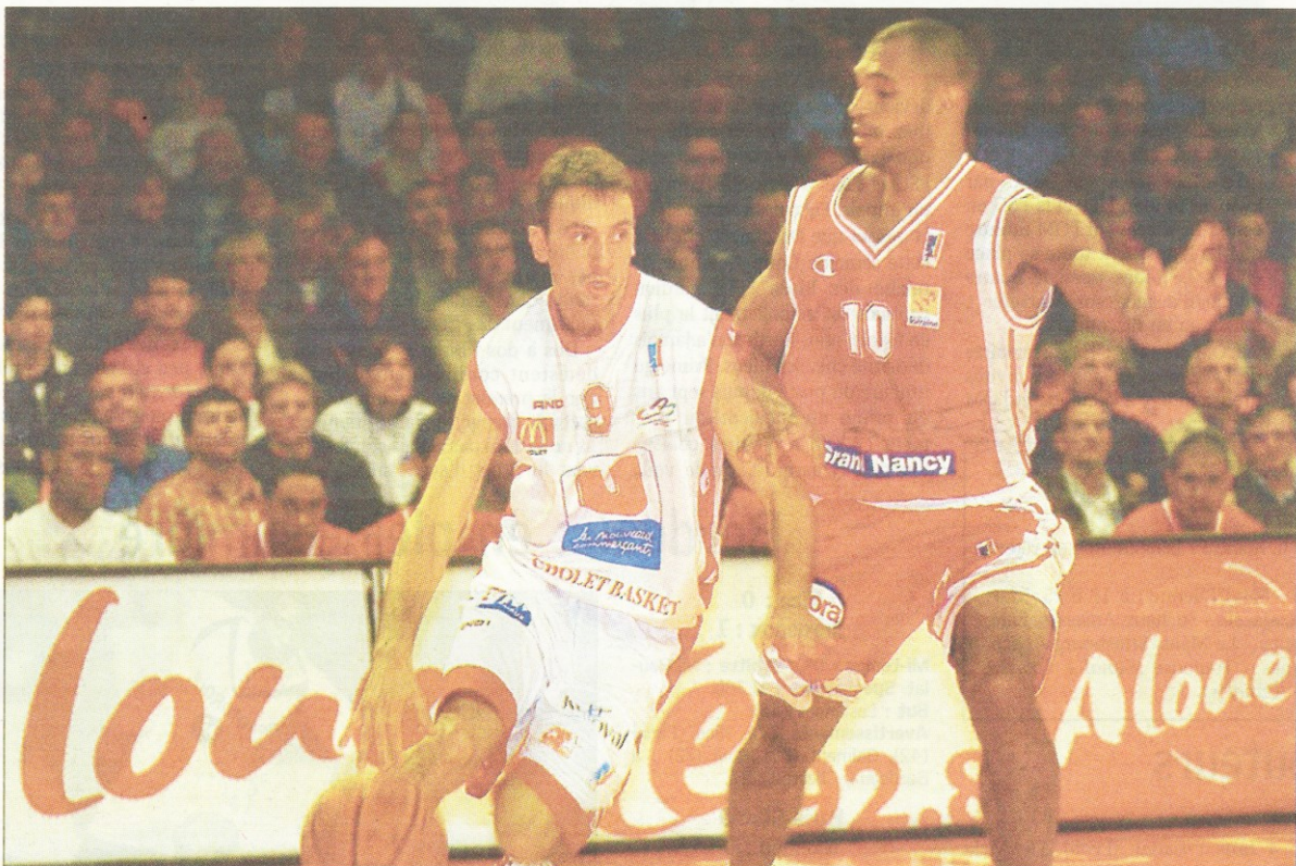
A l'image de Ferchaud, face à Zianveni, les Choletais ont maîtrisé leur sujet