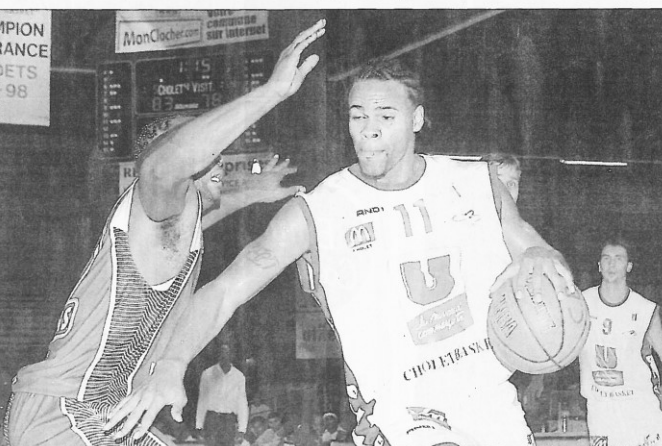
Marquis tout vite pénalisé par les fautes, Cholet ne put plus diversifier son jeu comme à son habitude. Le coup fut fatal en Bresse.

● Locations pour Cholet - Pau-Orléans. La rencontre entre la formation des Mauges et l'Elan béarnais se déroulera dimanche après-midi (15h) et sera retransmise en direct sur TPS Star. Afin d'assister à cette rencontre, il sera possible de réserver des places au Smash (3, avenue Marcel-Prat à Cholet), samedi 8 octobre de 9h30 à 12h. Il est également possible de réserver par téléphone au 02 41 98 30 30 jusqu'au samedi 8 octobre midi.