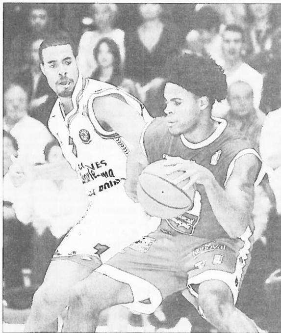
En début de deuxième mi-temps, CB s'est mis à bafouiller son basket.

La première mi-temps avait été tout autre car si la Jeunesse Laïque ouvrit le score (2-0) par Torbert, l'adversaire se rebiffa aussitôt, trouvant de bonnes posi-