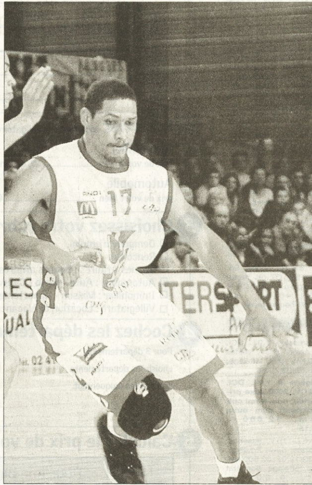
L'Américain effectue une pigne très réussie à Cholet Basket.