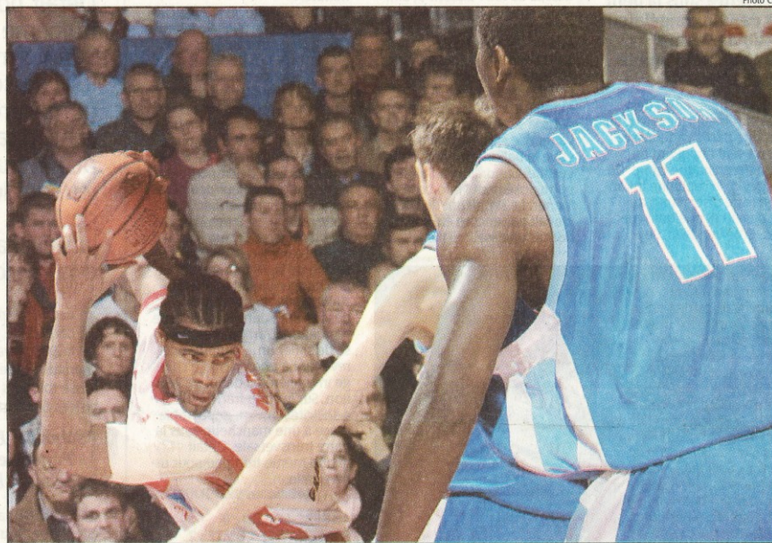
Marquis et les Choletais n'ont jamais trouvé la clé pour percer le double rideau défensif mis en place par Jackson et les Parisiens

Il faut bien reconnaître que les joueurs de la capitale adorent le contact physique, d'où un système défensif souvent très rugueux. Comme tous les autres entraîneurs de Pro A, Ruddy Nelhomme regrette