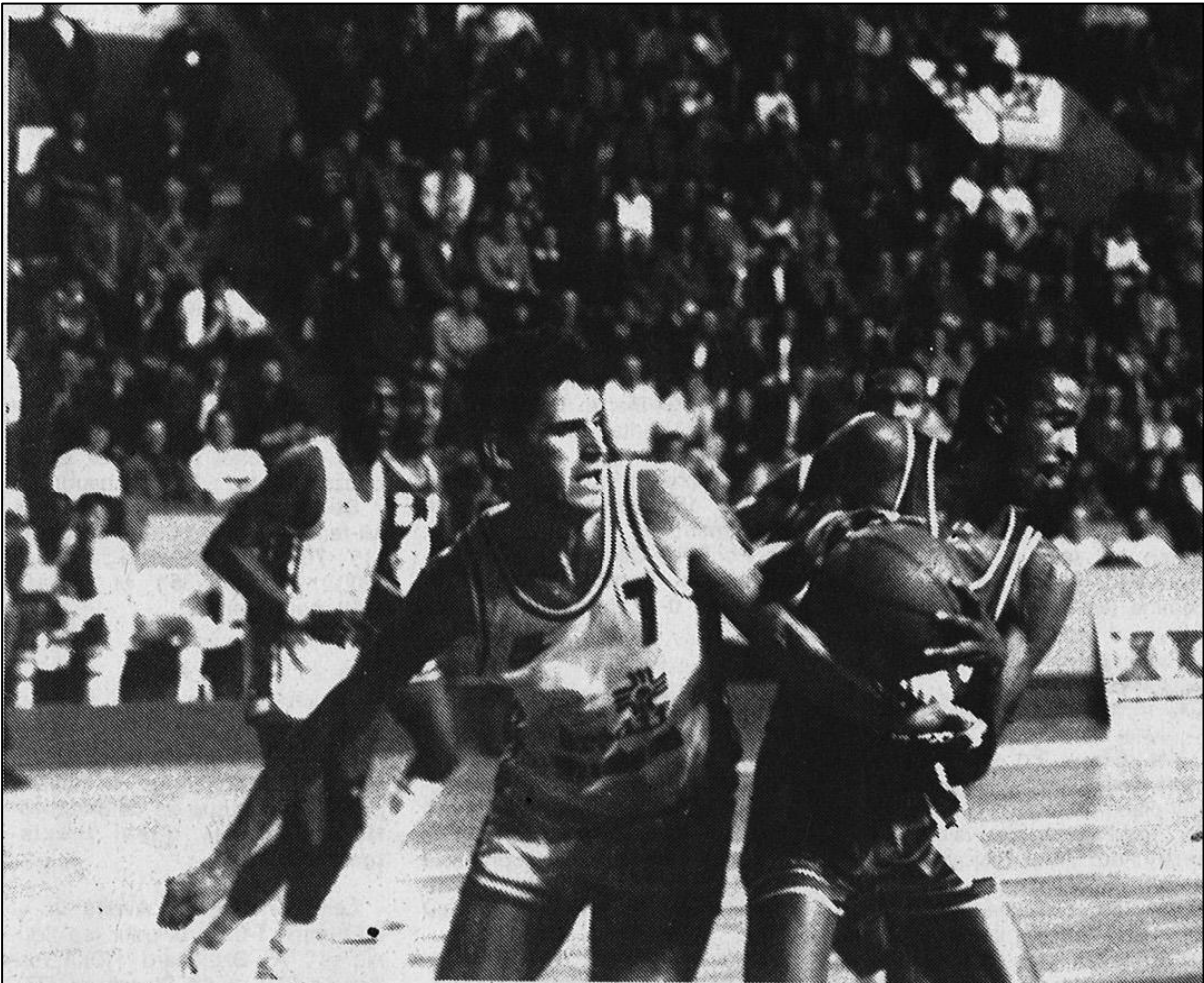
TOURS - CHOLET. — Pris en boîte par Hergott qui n'utilisa pas toujours des moyens très orthodoxes, Warner faillit pourtant sur la fin préserver un succès choletais.