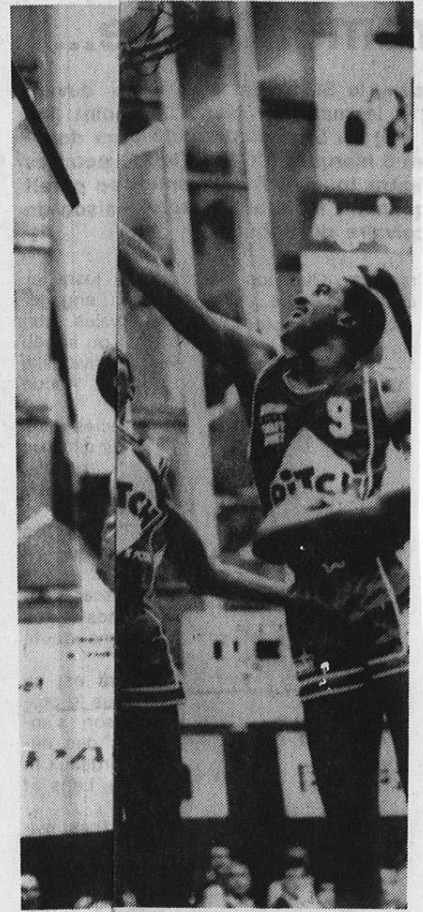
SAINT QU et Cham à la lutte au rebond avec F. L.