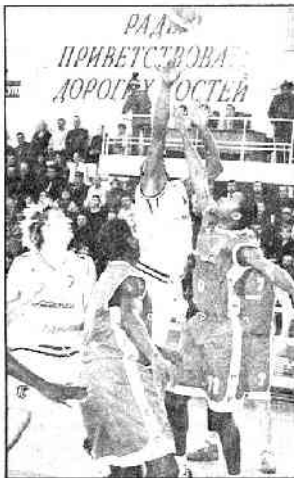
Marquis et les Choletais n'ont pas tenu la distance