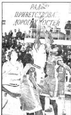
Marquis et les Choletais n'ont pas tenu la distance