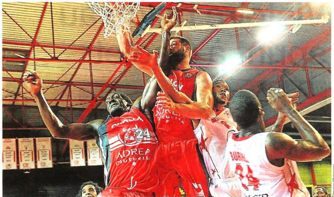
À l'image de cette action de Brockman et « JBAM » (à gauche), Chalon a largement dominé Cholet au rebond.

Car, question de sacrifice, son équipe a largement été dominée (41 rebonds à 24). « On n'a pas su les arrêter. On n'a pas su garder la dureté défensive que l'on est parvenu à trouver à certains moments. Il fallait défendre en