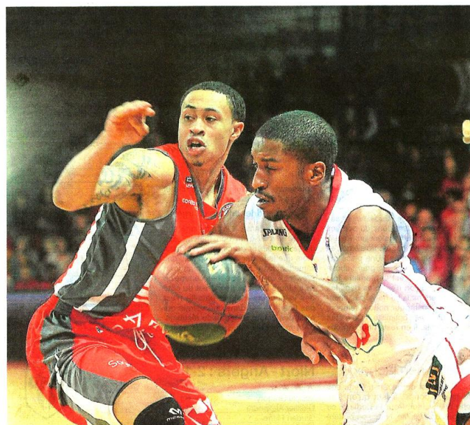
Les Choletais ont lourdement chuté contre Chalon-sur-Saône, leur défense a pris l'eau (85-104). page 10