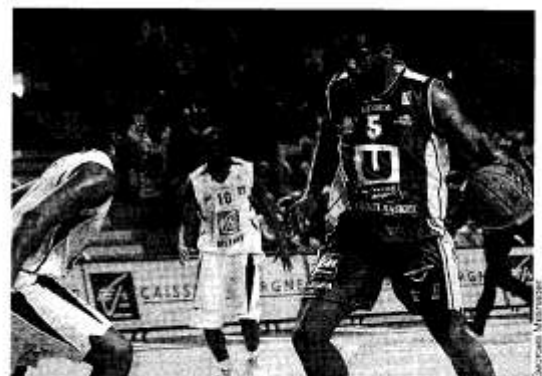
La solidité défensive d'Edwards permet à CB de bouclier enfin la raquette et de repartir de l'avant, sur la base d'une défense retrouvée.

Location pour CB- Hyères-Toulon, samedi. CB recevra deux fois cette semaine puisqu'après Paris, c'est Hyères-Toulon qui se présentera à la Meilleraie, samedi, pour le compte du championnat cette fois. Il sera possible de réserver des places au Smash, samedi de 9h30 à 12h ou par téléphone au 02 41 58 30 30 ou au 02 41 71 65 12.