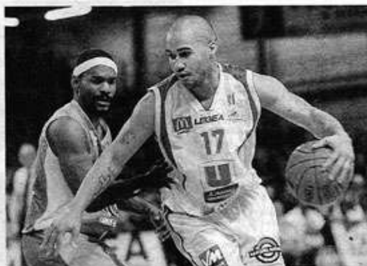
Relancé en championnat, toujours en course en Eurochallenge dont il entamera les quarts-de-finale dès demain soir face à Kiev, également en lice en coupe de France, Cholet-Basket bataille sur tous les fronts. L'ultime rescapé français en coupe d'Europe doit gérer un mjeux ce calendrier surchargé.