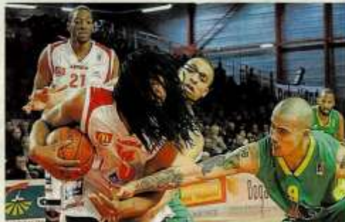
Malgré la pression, Falkov conserve le ballon.