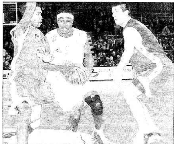
Le duel Ball-Rowe a quelque peu laissé les spectateurs de la Meilleraie sur leur faim. Le Choletais a finalement pris les choses à son compte dans la deuxième mi-temps.

Ceci étant, on sait très bien que ce n'est pas à Cholet que l'on jouait notre saison. Notre but, c'est d'abord d'assurer le maintien, et après d'accrocher si possible la 12 e place pour participer aux playoffs. »