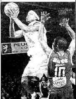
Ball a tiré CB d'un mauvais pas

Autre première, ce succès acquis en ayant abandonné 88 points à l'adversaire. Jamais encore cette saison en Pro A, l'équipe des Mauges n'avait réussi à s'imposer dès lors qu'elle avait laissé sa rivale dépasser les 82 points. A quatre reprises, CB s'est ainsi incliné (83-54 à Clermont, 81-90 devant l'ASVEL, 91-63 à Vichy, 90-87 à Pau).