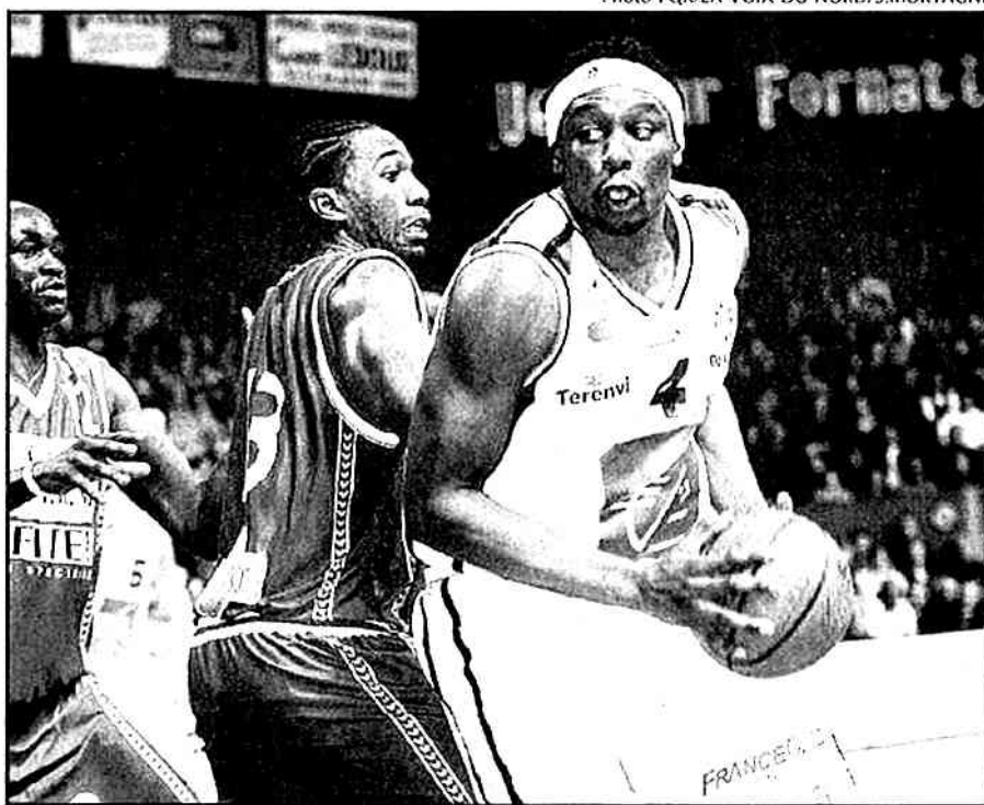
Wesson et Gravelines ont dominé Fajardo et Strasbourg

Dans les autres rencontres, les participants à la Semaine des As dans quinze jours ont assu-