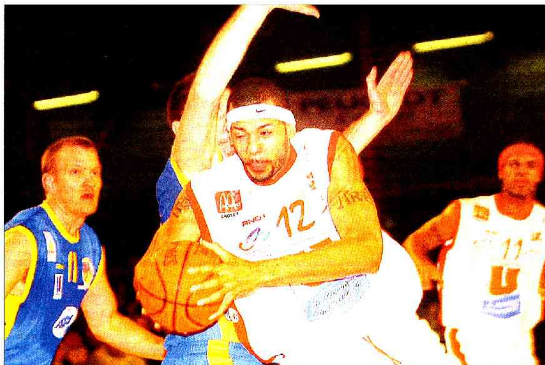
Akpmedah, qui devance le Varois Milling, et les Choletais poursuivent leur belle série.

Même s'ils ont souffert pour s'imposer face à Hyères-Toulon (101-88), les Choletais ont assuré l'essentiel et remporté leur quatrième succès consécutif en Pro A.