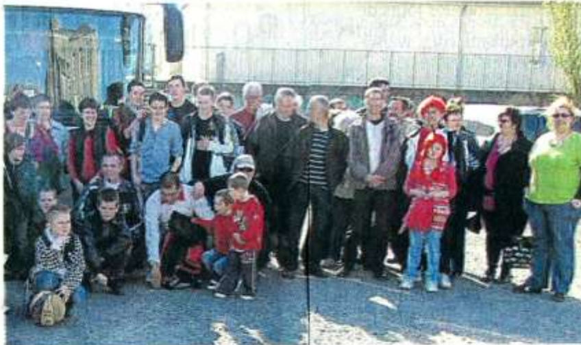
Avant le départ en car des supporters de Cholet-Basket.

Samedi, le club de basket germinois avait réuni 87 personnes pour aller voir évoluer une équipe professionnelle, Cholet-Basket, et en apprécier le jeu de haut niveau dans une salle de La Meilleray pleine à craquer.