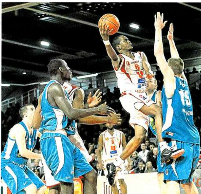
Cholet, La Meilleraie, hier soir. Rodrigue Beaubois dans ses œuvres.