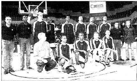
L'équipe choletaise démarre son championnat samedi soir.

"Notre objectif est de développer un jeu rapide. Toujours en mouvement ce sera notre marque de fabrique. Quant au plan sportif, on ne peut pas dire