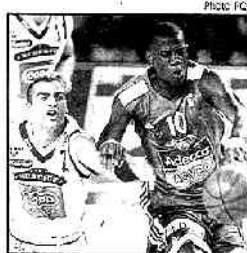
Villeurbanne et Touré sont tombés de haut devant Nissim et Strasbourg

également de grosses ambitions cette saison, est lui tombé de haut en s'inclinant de 14 points à domicile face à un Le Havre détonant détonant dans le quatrième quart-temps. Hyères-Toulon a carrément explosé à domicile face à Dijon (76-93), alors que Vichy et Limoges ont fait une superbe opération en s'imposant sur un score presque identique à Roanne (79-72) et à Bourg-en-Bresse (79-73). Chalon-sur-Saône a échappé au syndrome de la soirée en dominant chez lui Nancy (100-93) dans le match le plus prolifique du jour. Par ailleurs, le promu Besançon a fait d'emblée connaissance des rudes réalités de la ProA en chutant dans sa salle