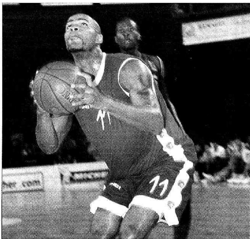
Marquis et le Cholet Basket ont bien entamé leur saison.

Besançon : 24 paniers (dont 3 sur 20 à 3 pts) sur 60 tirs - 5 LF sur 7 tentés - 36 rebonds - 14 passes dé-