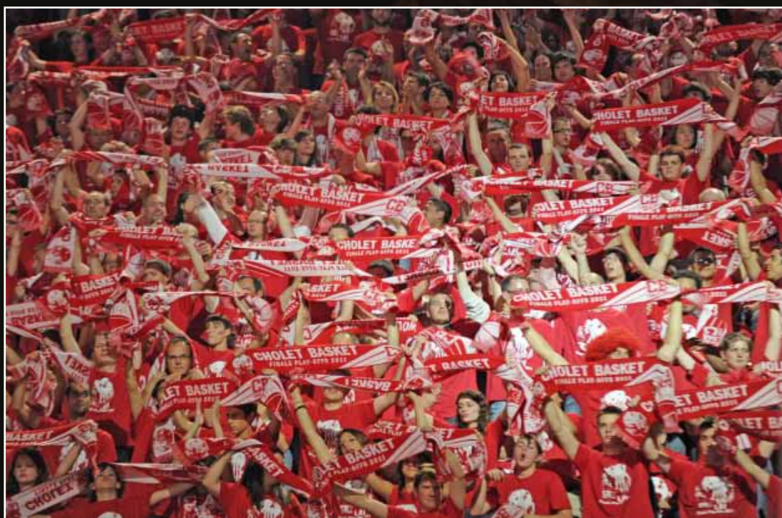
Finale Championnat de France Pro A 2011 - Bercy.

Les présentes Conditions Générales de Vente des Abonnements sont soumises au Droit français. Tout litige relatif à l'achat ou l'utilisation d'une Carte d'Abonnement devra être porté à la connaissance de Cholet Basket par lettre recommandée à l'adresse suivante : SASP Cholet Basket - Service Billetterie/Abonnement – 3 avenue Marcel Prat – BP 10752 – 49307 Cholet Cedex. A défaut de règlement amiable, les tribunaux français seront seuls compétents.