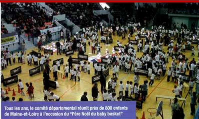
Tous les ans, le comité départemental réunit près de 800 enfants de Maine-et-Loire à l'occasion du "Père Noël du baby basket"