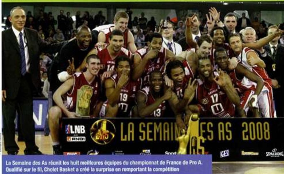
La Semaine des As réunit les huit meilleures équipes du championnat de France de Pro A. Qualifié sur le fil, Cholet Basket a créé la surprise en remportant la compétition

C'est vrai que notre public dépasse la seule ville de Cholet, et va même au-delà du département. Nous avons des supporters de Vendée, du nord des Deux-Sèvres, de Loire-Atlantique... Le rayonnement du club, c'est aussi son centre de formation. Plusieurs grands noms du basket français y ont été formés, comme Jim Bilba et Antoine Rigaudeau, médaillés d'argent aux JO de Sydney. Michaël Gelabale a, lui, été recruté en NBA, aux Seattle Supersonics. Et cette année, Nando De Colo, sacré meilleur joueur de la Semaine des As, a été le seul Français sélectionné pour le "All-star game" européen.