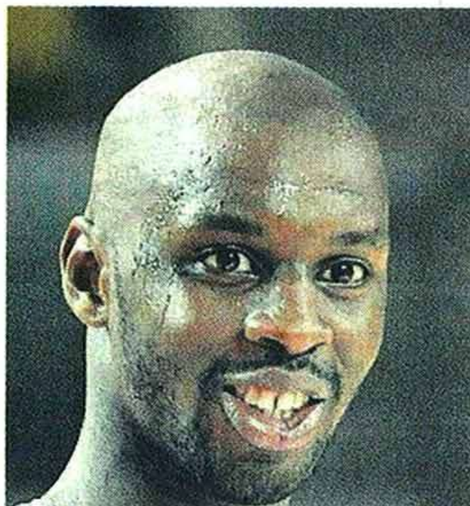
Mamoutou Diarra.

À Cholet, Diarra retrouvera Vebobe et Nelson, ex-partenaires du Paris BR et Avellino (Italie). « Je connais aussi Marquis et Mejia. Ça devrait faciliter l'intégration. Pour le reste, disons que je suis « bof » physiquement. Je risque d'en