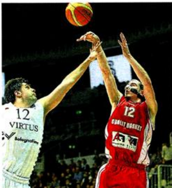
De Colo et les Choletais sont passés à deux doigts d'un exploit extraordinaire.

Se croyant arrivée trop tôt, la Virtus commît l'erreur de se mettre en roue libre en défense et De Colo (6 points dans la 37') remplaça Cholet en situation de créer l'exploit (74-71, 37'), d'autant que Ford tremblait aux lancers (0/2 dans la dernière minute. 76-75, 40'). Pas Langford (77-75).