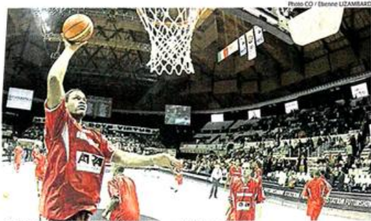
APPLICATION. Les Choletais à l'heure de l'échauffement.