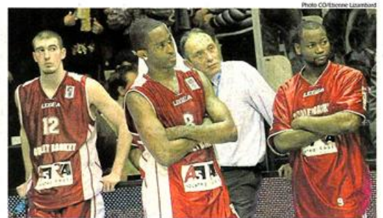
TRISTESSE. Les joueurs et le coach choletais, le visage marqué, après le match.

Le Courrier de l'Ouest - Lundi 27 avril 2009