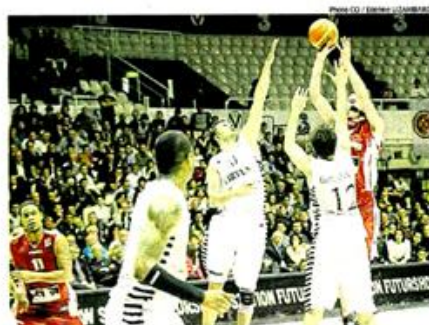
Nando De Colo a été le meilleur marqueur de la finale avec 24 points. En dépit de ce dernier tir manqué.