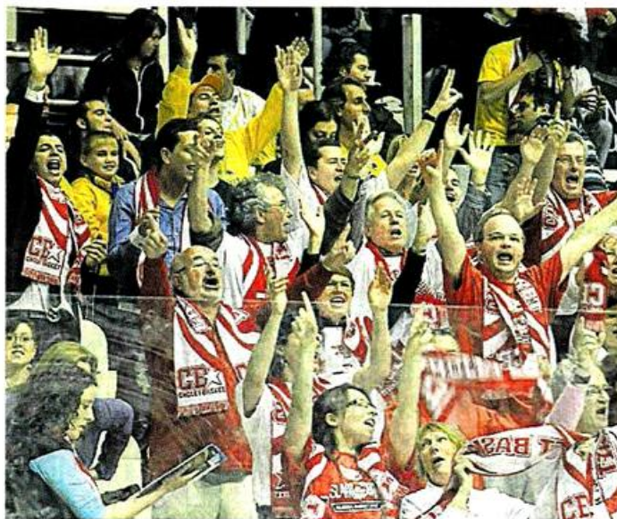
A. B. Bologne, Futurshow station, hier. La quarantaine de supporters choletais ont tout donné, même dans la défaite.

Mais aucun supporter ne voulait refaire le match hier soir à l'issue de la rencontre. Tous ont longuement applaudi leurs protégés qui ont été se réfugier dans les vestiaires... voyant que la cérémonie protocolaire ne prenait en compte que le vainqueur (!). « C'est dommage, se désole un supporter. On aurait aimé aussi les voir sur le parquet et sous la lumière. » Mais personne n'oubliait hier soir que leur parcours européen a été cette année exemplaire.