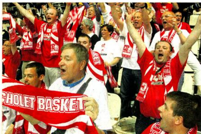
Après le fol espoir des supporters choletais...