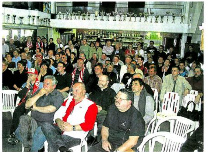
Les supporters rassemblés au Smash.