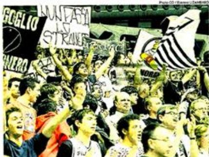
Les Italiens de la Virtus de Bologne ont assuré une ambiance extraordinaire, hier à la Futurshow Station.