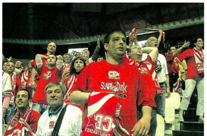
...La frustration. Mais aussi la fierté.