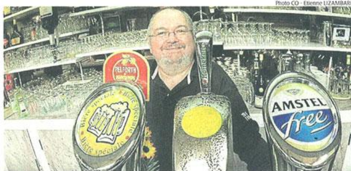
Cholet, le Smash, mardi 14 avril. Chez le plus supporter des supporters, la pression monte avant le Final Four.