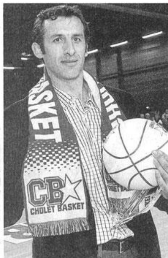
Antoine Rigaudeau de retour à la Melleraie en 2005, quelques semaines après avoir annoncé sa retraite.