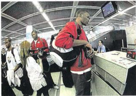
Nantes, 14h55. Les joueurs ont pris place dans un petit avion de 50 places.