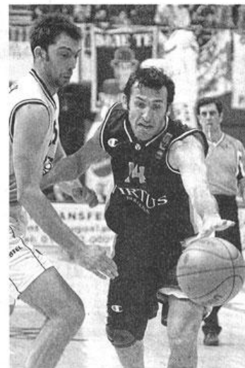
Les années fastes sous le maillot de la Virtus Bologne, ici lors d'un match d'Euroligue à Belgrade, en 2002.