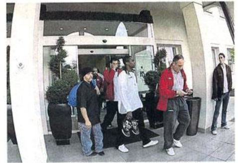
Bologne, 18 heures. À peine le temps de déposer les affaires à l'hôtel que les joueurs doivent aller respirer l'air de la salle.