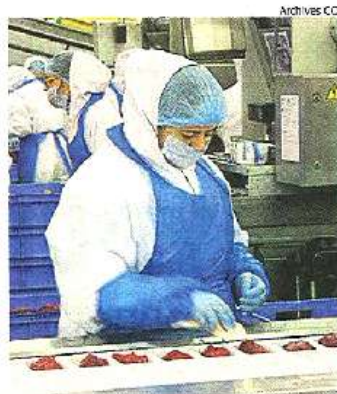
Un atelier de production Charal.

Bébé Confort : La marque d'articles de puériculture n'a pas vu le jour à Cholet. Elle a rejoint la société choletaise Morellet-Guérineau (landaus et jouets) en 1968 et a fusionné avec elle en 1976 pour devenir Ampafrance, une société rachetée en 2003 par l'actuel groupe canadien Dorel. Charal : La marque de viande bovine Charal a été créée en 1986 par le groupe Vital Sogéviandes, société parisienne d'abattage et de transformation de produits carnés. En 1997, la société Vital Sogéviandes est dé baptisée et prend le nom de Charal. Deux ans plus tard, le siège social de Charal est établi à Cholet. Charal dépend aujourd'hui du groupe Bigard.