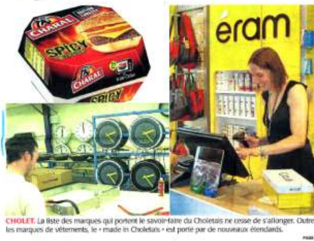
CHOLET. La liste des marques qui portent le savoir-faire du Choletais ne cesse de s'allonger. Outre les marques de vêtements, le « made in Choletais » est porté par de nouveaux étendards.

Le Courrier de l'Ouest – Jeudi 20 juin 2013