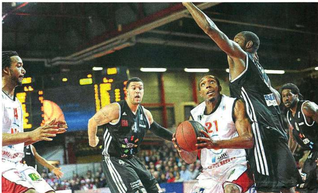
Cholet, le 9 décembre. CB reçoit plus de 1,3 million d'euros d'argent public par an.

« Il est légitime qu'on interroge toutes les dépenses. D'autant plus quand elles sont facultatives, indique Christophe Béchu (UMP). Il faut toutefois relativiser ce qu'on peut en attendre. Le total des aides au haut niveau (772 000 €, N.D.L.R.) ne représente en effet que 0,1 % du budget du Département (650 millions d'euros, N.D.L.R.) ». Les