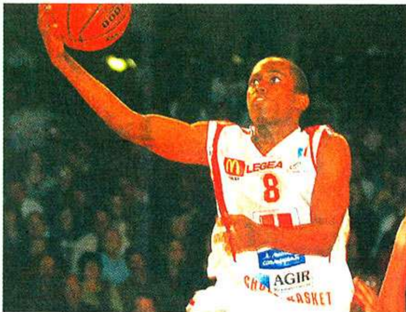
Archives Georges Mesnager

Les Suisses parurent cependant revenir des vestiaires avec de toutes autres intentions, défensives en particulier. En s'imposant au rebond (27 prises à 23 à la 25') sous la houlette d'un Allen déjà nanti d'un double (10 points, 10 rebonds) à ce moment-là, le Benetton se refit une petite santé (39-45, 14'). Nando De Colo refroidit toutefois ses ardeurs : le Ch'ti