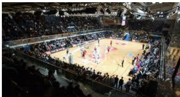
Salle Pierre de Coubertin