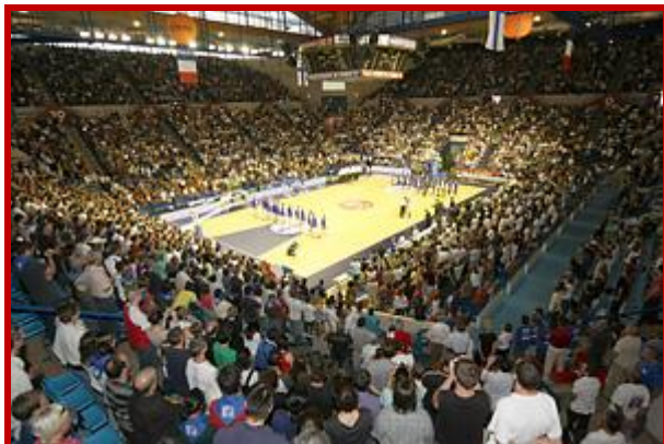
Palais des Sports de Pau