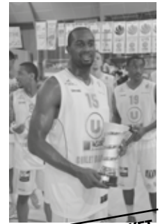
CHOLET BASKET VAINQUEUR DU TROPHÉE SARTHE PAYS DE LA LOIRE

CHOLET BASKET : VAINQUEUR DU TROPHÉE SARTHE PAYS DE LA LOIRE