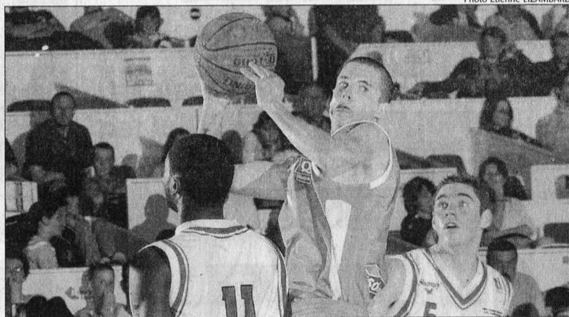
Les Palois ont fait tomber le champion de France