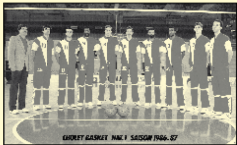
CHOLET BASKET N1A SAISON 1986-87