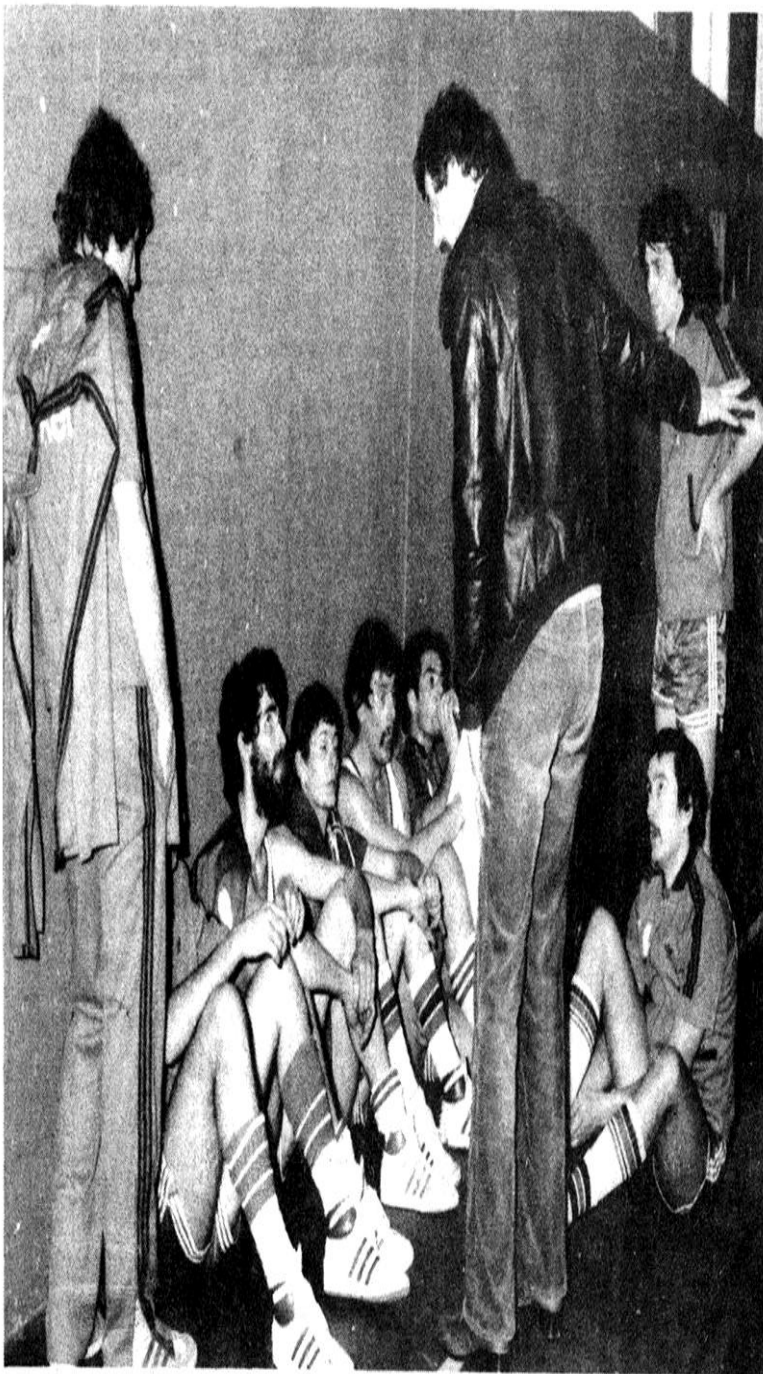
L'équipe de Cholet-Basket au cours d'un temps-mort pendant le mtach contre La Séguière de la mi-temps. Bégrolles