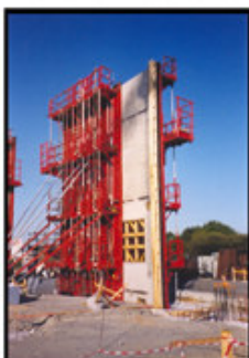
Mateloc présent sur le chantier du Zénith à Nantes