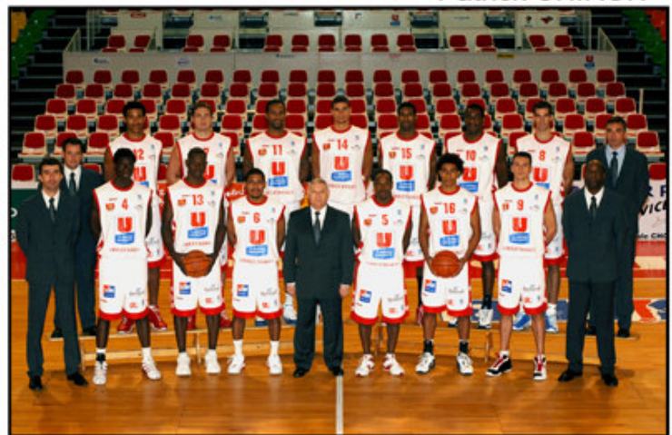
L'équipe Pro de CHOLET BASKET Saison 2005/2006