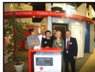
Notre stand à BATIMAT

COMEC ZA de Montevi 49280 LA TESSOUALLE Tél : 02 41 63 40 40 - Fax : 02 41 58 10 38 Email : contact@lacomec.fr