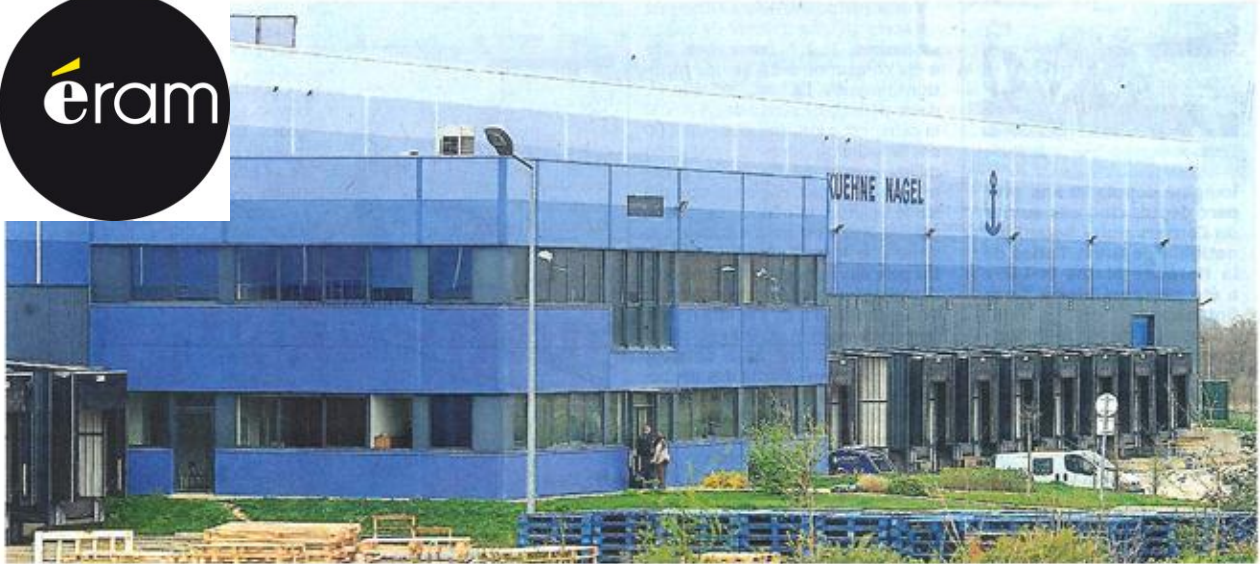
Beaulieu-sur-Layon, mars 2014. Anciennement géré par Kuehne-Nagel pour Conforama, le site va changer de nom.

E n mars 2014, la nouvelle avait été mal reçue : Conforama rompait son contrat avec le logisticien Kuehne-Nagel sur le grand site logistique Actiparc de Beaulieu-sur-Layon. Le gigantesque bâtiment bleu de 31 000 m 2 et ses quelque 35 quais d'embarquement, immanquables depuis la RN 160, devenaient sans objet. Et une trentaine d'emplois disparaissaient dans la douleur.