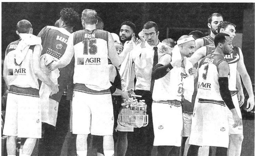
Mines défaites, regards dans le vide... les Choletais ont bouclé leur saison à domicile par une 11 e défaite à la Meilleraie !

Pour quiconque a connu les grandes années de CB, en Pro A et sur la scène européenne, l'heure est forcément à la nostalgie. Jadis si redoutés par les adver-