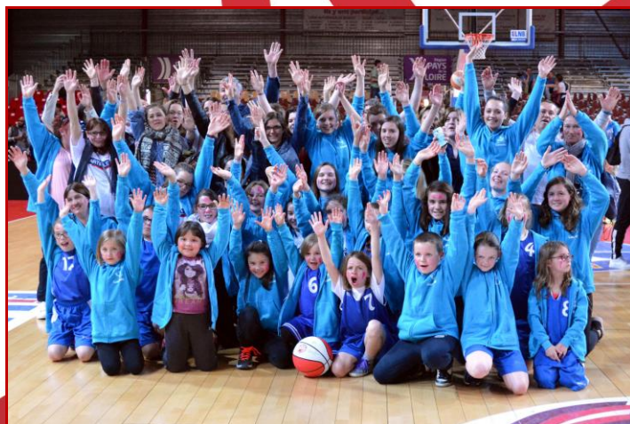
St Augustin des Bois et St Hubert Sport Lanouée étaient les clubs les plus nombreux !