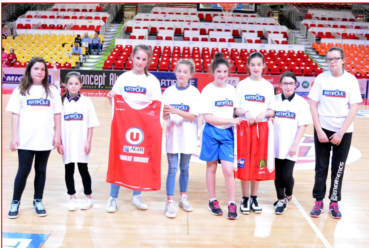
St Augustin des Bois remporte le Challenge face à St Hubert Sport Lanouée.