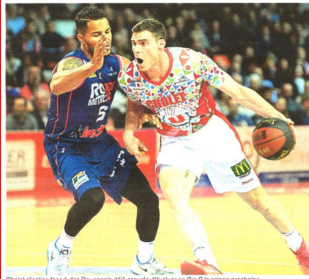
Cholet s'incline face à des Rouennais déjà assurés d'évoluer en Pro B la saison prochaine.