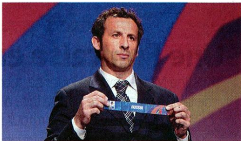
MARNE-LA-VALLÉE (Seine-et-Marne), DISNEYLAND PARIS, 8 DÉCEMBRE 2014. - L'ex-international Antoine Rigaudeau lors du tirage au sort de l'Euro 2015.

L'ANCIEN INTERNATIONAL (128 sélections) et vainqueur de l'EuroLigue (1998, 2001) Antoine Rigaudeau (43 ans) nous a confirmé, hier, les informations de L'Équipe.fr évoquant des contacts avec le club de la capitale. «J'ai été contacté par le PL. C'est tout neuf et, personnellement, je souhaite m'investir dans le monde du basket côté terrain dans les mois ou années à venir. Donc dans du coaching. Le projet PL est une possibilité», indique l'ancien meneur de jeu médaillé d'argent aux JO de Sydney (2000) avec les Bleus.