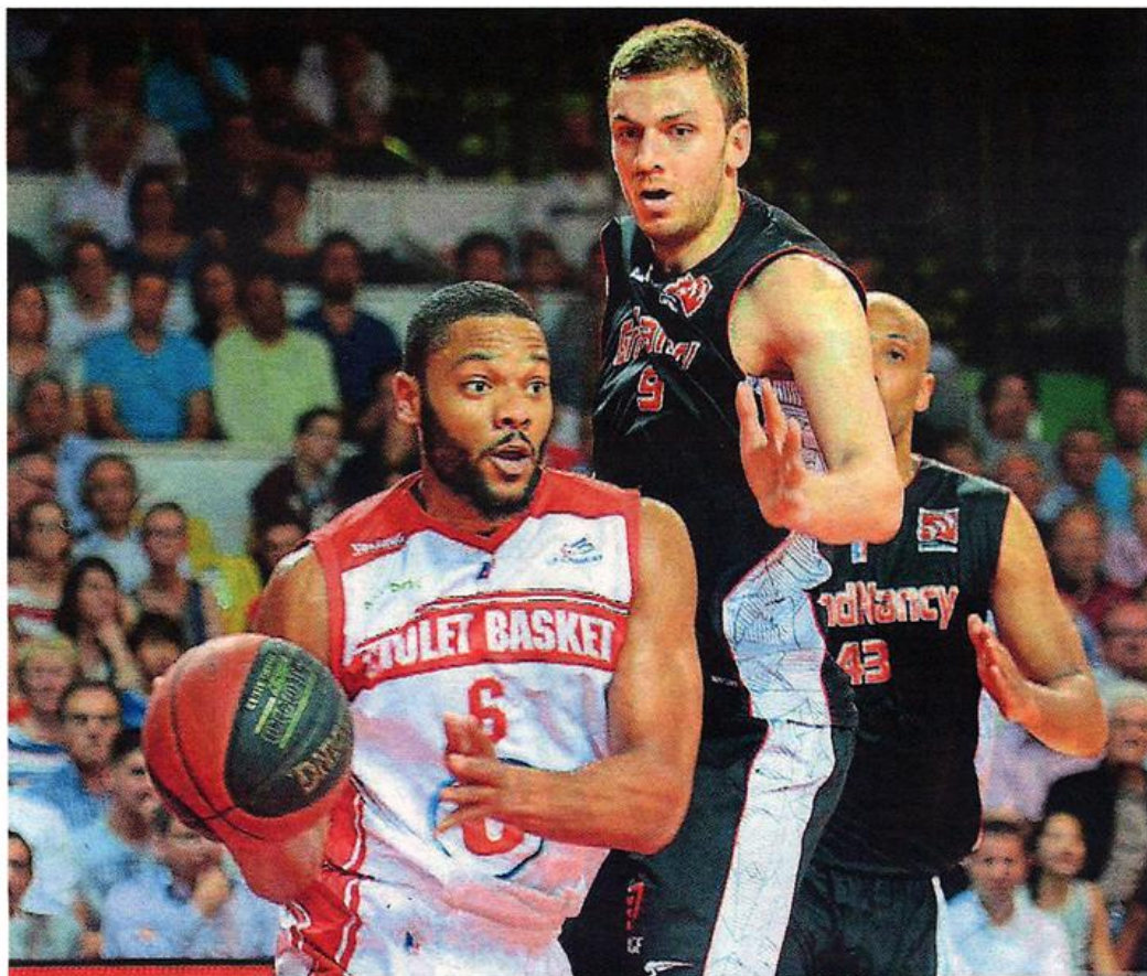
Jomby a réalisé un festival à trois points dans le dernier quart. Insuffisant pour permettre à CB de finir la saison sur un succès.

Car, outre le fait de donner un peu plus de voix au Colisée, cette double sanction fut bien sûr exploitée en termes de points par les Chalonnais. CB avait perdu le fil, l'adresse (8 échecs consécutifs