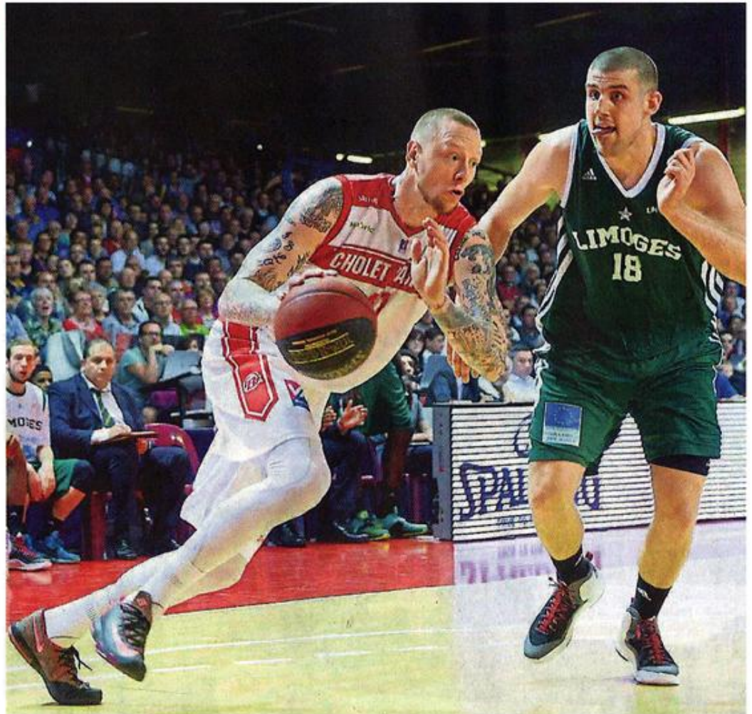
Cholet, la Meilleraie, le 13 avril. Malgré les 13 points de Minnerath, Cholet repart bredouille de Chalon et termine sa saison par une défaite.

Les Chalonnais ne relâchaient pas la pression. Mais Cholet répondait avec ses moyens. Grâce à quatre réussites lointaines de Rudy Jomby, juste avant qu'il ne quitte le parquet pour cinq fautes. Banks et Jones faisaient passer des sueurs froides au public chalonnais en rapprochant les Choletais à 7 points (87-80) alors qu'il ne restait à jouer qu'un peu plus de deux minutes. Le jeune Morency réduisait encore plus l'écart à moins de trente secondes de la sonnerie