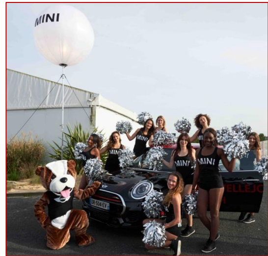
Arrivée des PomPoms MINI à la salle