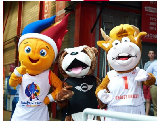
Les 3 mascottes Frenkie (EuroBasket 2015), Spike (Mini) et Charalito mettent aussi l'ambiance !