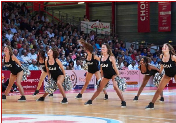
Les PomPoms MINI font le show !