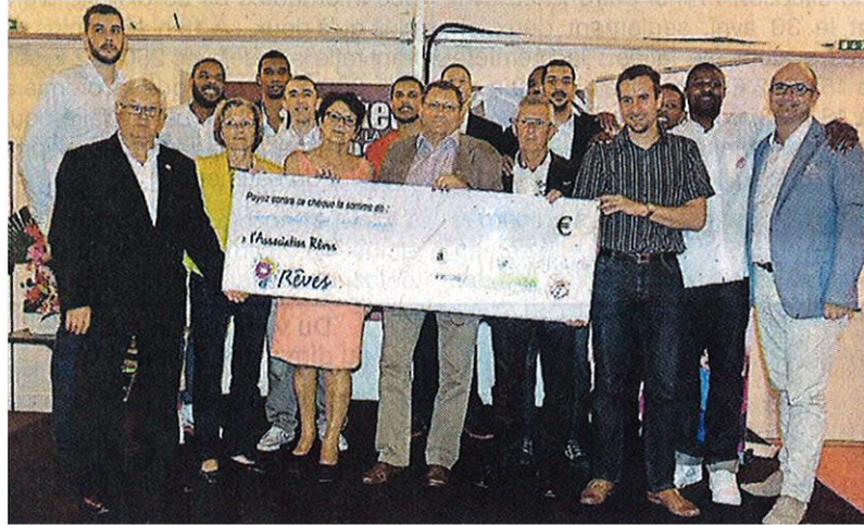
L'équipe de CB au moment de la remise de la cagnotte.

L'adresse retrouvée des basketteurs de Cholet-basket, mardi soir contre Nancy, ne leur a pas seulement permis de renouer avec la victoire. En scrorant à trois points, ils ont alimenté une cagnotte au profit de la délégation Rêves du Maine-et-Loire, qui aide des enfants malades à réaliser un rêve. CB, avec la société Gautier, a ainsi fait un don de 2 800 €, qui