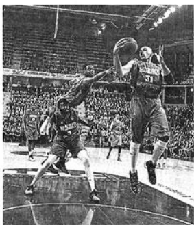
Aka et les Monégasques s'imposent sur le parquet de l'Asvel. La Roca Team est première de Pro A.

Paris Levallois - Gravelines.....83-63 (14-22, 31-14, 17-19, 21-8). Arbitres : MM. Difallah, Gueu et Creton. PARIS LEVALLOIS : Oniangue (10), Ndoye (19), Dawson (6), Poirier (23), Eliezer-Vanerot (9), Jones (9), Rich (2), Sane (3), Stansbury (2). GRAVELINES DUNKERQUE : Morency (3), Gray (17), Ablicy (5), Dove (11), Aboudou (1), Mukubu (6), Paschal (3), Brown (2), Sy (11).