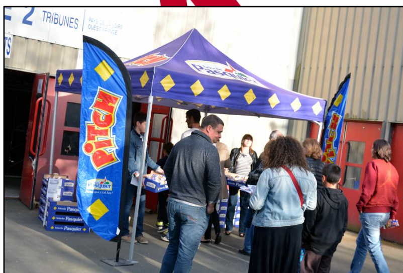
Distribution de brioches PITCH aux entrées de la Meilleraie