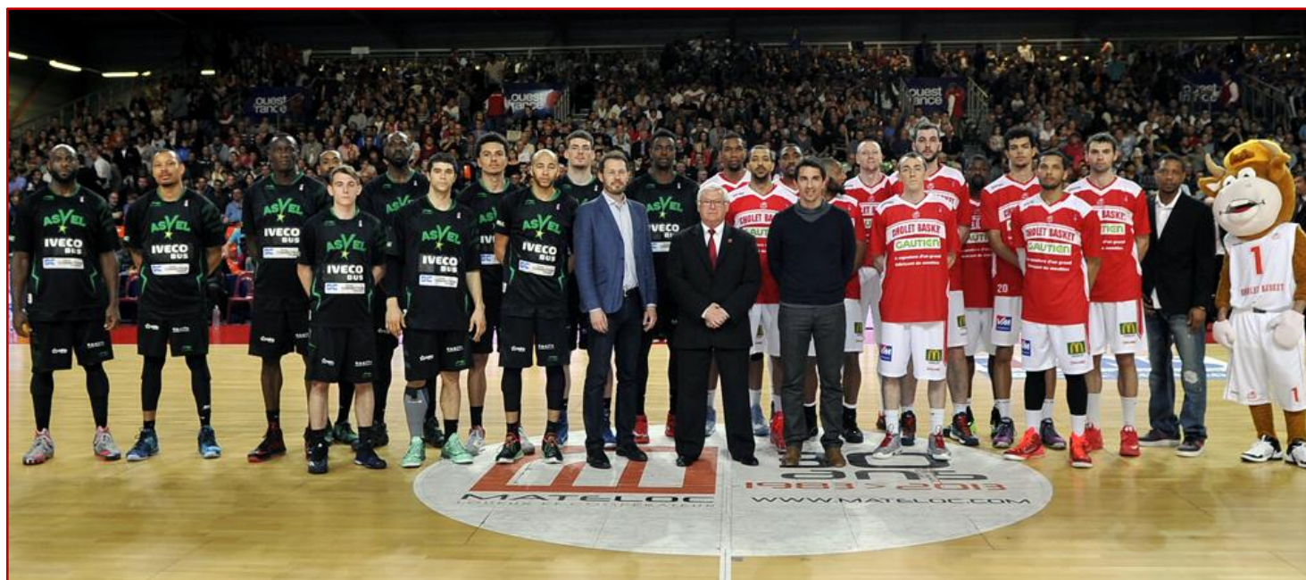
Avant le coup d'envoi, les 2 équipes se sont réunies au centre du parquet pour soutenir les Journées de l'Avenir