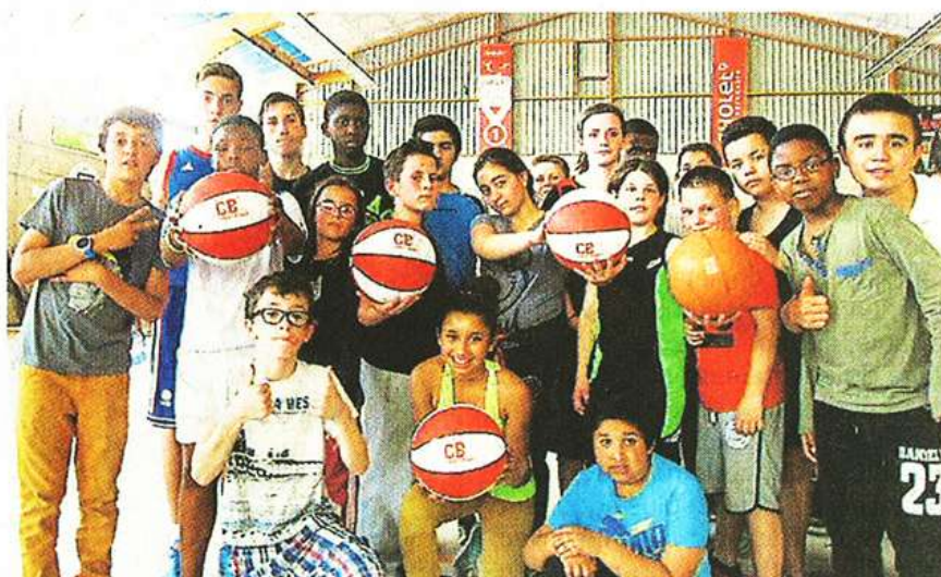
Horizon, Planty, Ocsigène, Verger, Pasteur, K'leidoscope et Chloro'fil, tous réunis autour des ballons de basket.

Ça se passe dans les quartiers. Les sept centres du Choletais se sont retrouvés, hier, pour un tournoi de basket.