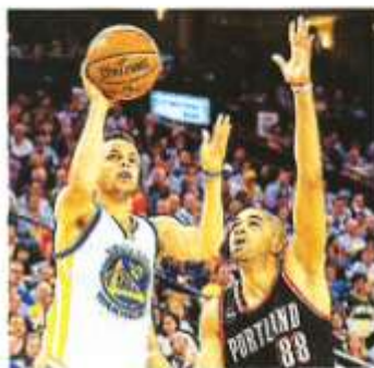
Nicolas Batum (à droite), ici opposé à Stephen Curry (Golden State), s'est blessé lundi.

Les résultats de lundi : Golden State - Memphis 111-107 ; LA Clippers - Denver 110-103 ; Atlanta - New York 108-112 ; Brooklyn - Chicago 86-113 ; Miami - Orlando 100-93 ; Sacramento - LA Lakers 102-92 ; Utah - Dallas 109-92 (Gobert 20 pts, 17 rbd en 37') ; Minnesota - La Nouvelle-Orléans 88-100 (Ajinça 5 pts, 6 rbd en 18') ; Oklahoma City - Portland 101-