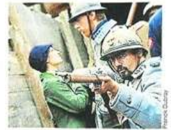
soldat et de sa fiancée. Ouverture du 11 avril au 27 septembre. Site Internet www.puydufou.com .

Avec un niveau de réservation « en hausse de 15 % » par rapport à l'an dernier et des pics « à + 38 % en avril et + 26 % en mai », le Puy du Fou se prépare à accueillir de nouveau un public très nombreux en 2015. Une fréquentation qui devrait conforter son statut de deuxième parc français (1,9 million d'entrées), derrière l'indétrônable Disneyland de Marne-la Vallée. Cette année, un spectacle inédit, Les Amoureux de Verdun (photo), va permettre aux visiteurs de s'immerger dans les tranchées de la Première Guerre mondiale. Ils vont y suivre la correspondance d'un