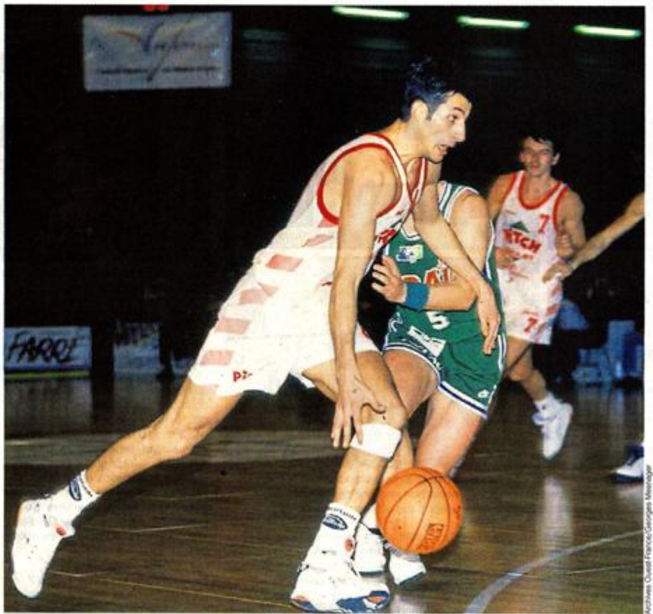
Antoine Rigauudeau jouant sous le maillot de Cholet Basket en 1993 contre Pau Orthez. Ancienne gloire de Cholet Basket, il dédicacera cet après-midi dans sa ville de naissance. Il y a laissé de nombreux souvenirs.