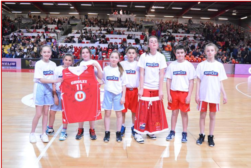
St Lumine de Clisson – Club vainqueur du Challenge