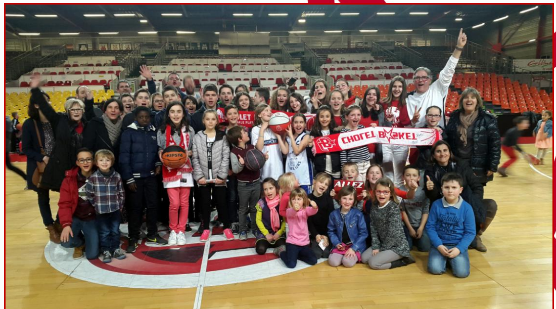
St Amand sur Sèvre – Club le plus dynamique