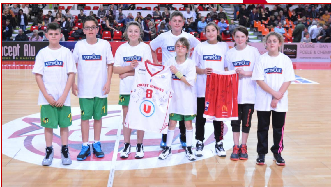
ST PERE EN RETZ (44)