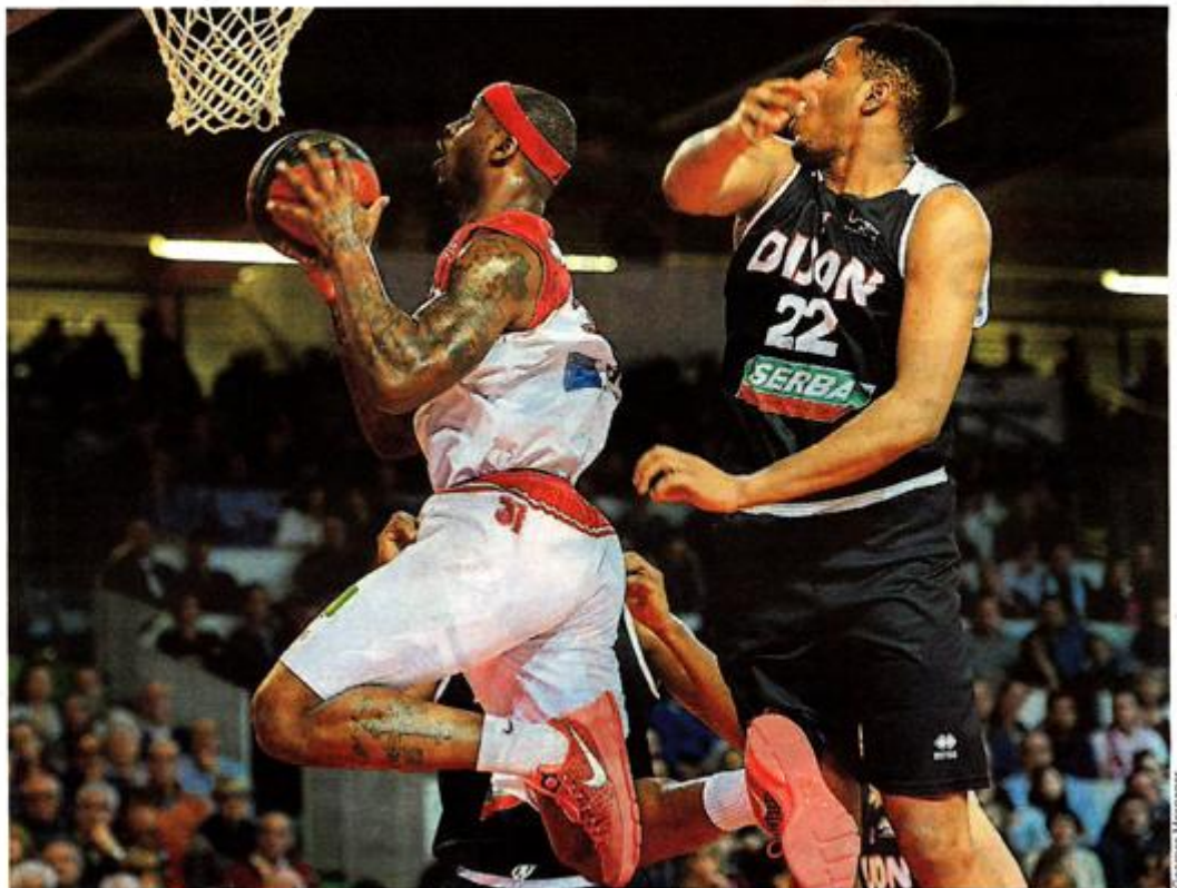
Holloway et les Choletais se sont fait peur mais ils continuent leur remontée fantastique.

Heureusement, CB avait davantage d'inspiration de l'autre côté du terrain. Holloway dans la raquette, Prince et Brun à trois points : l'alternance avait du bon et finissait par créer un premier écart (30-21, 15'). Mais à laisser trop de deuxième chances aux Bourguignons, CB finissait par se faire sanctionner ! À