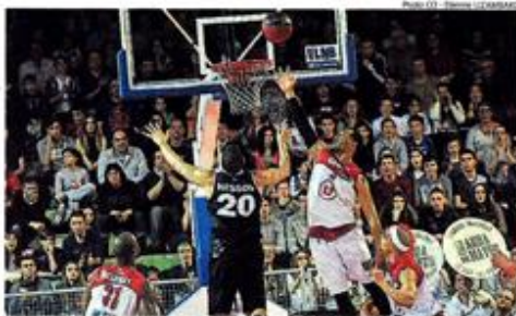
LA SÉRIE. En l'emportant à domicile, les Choletais se sont envolés vers une troisième victoire de suite. Une première depuis plus de deux ans.