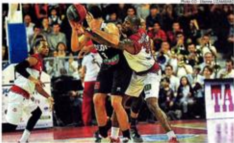
LE COMBAT. À l'image de ce duel, les Choletais d'Holloway ont longtemps souffert face à la puissance des Dijonnais.