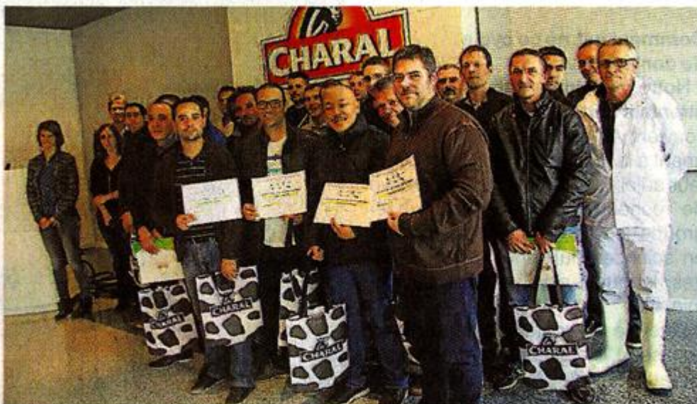
Les salariés avec leurs tuteurs, hier, à la remise des diplômes.

Le spécialiste du bœuf a remis, hier, à un groupe de salariés leurs diplômes, obtenus après un contrat de professionnalisation.