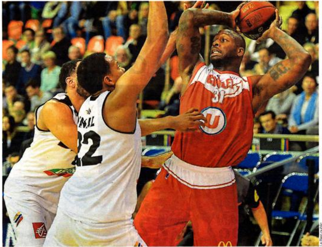
Holloway, à l'image des Choletais, a paru sans solution hier face aux Dijonnais.

Un 7-0 dans la musette juste avant la pause. Rebelote avec un autre 7-0 à la reprise. Les Choletais étaient devenus spectateurs et se retrouvaient distancés, sans même l'avisoir vu venir (35-24, 23'). Le coup de la panne. Plus de carburant, plus d'envie. Juste des balles perdues,