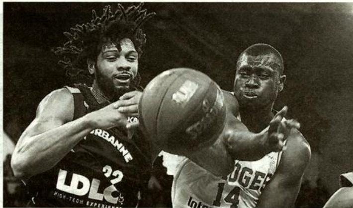
L'Asvel de Watkins a remporté le choc de la journée face au CSP Limoges de Zerbo.

Le Havre - Le Mans 73-76 (21-17, 15-17, 17-18, 20-24). Arbitres : MM. Bissang, Thepenier et Kerisit. LE HAVRE : Mutuale (2), Vassalo Angel (27), Brown (12), Hill (8), Jean (6), Deane