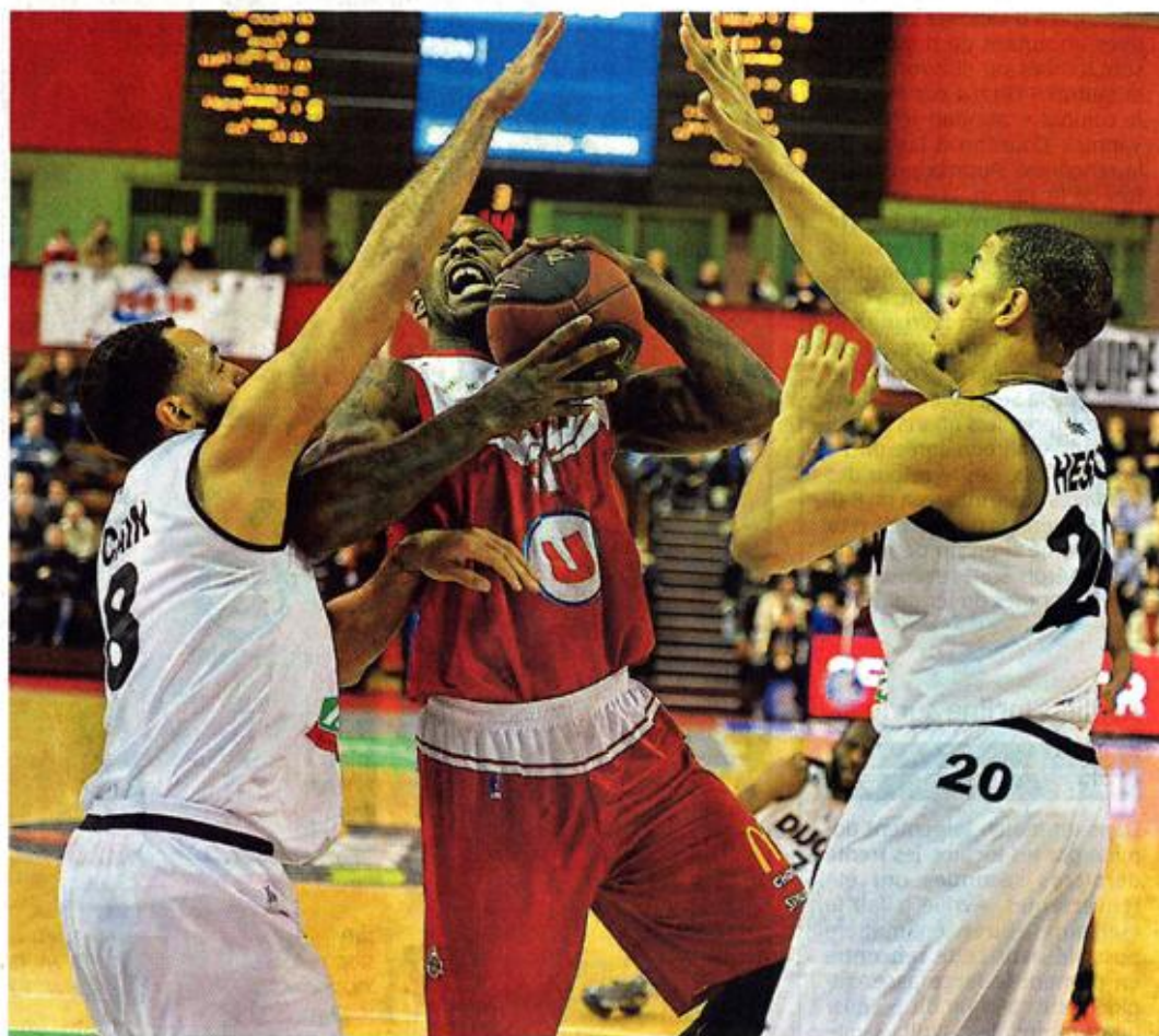
Dijon, Palais des sports, hier. Holloway et les Choletais ont passé une soirée cauchemardesque.

Pour tenter de « braquer la banque » en Côte-d'Or, la stratégie était de freiner au maximum l'allant d'une formation en confiance et portée par des pointures de la trempe de Williams (17 points en 28 minutes) ou Cain (18 pts en 26'). Mission accomplie tant bien que mal en première période où le spectacle n'a vraiment