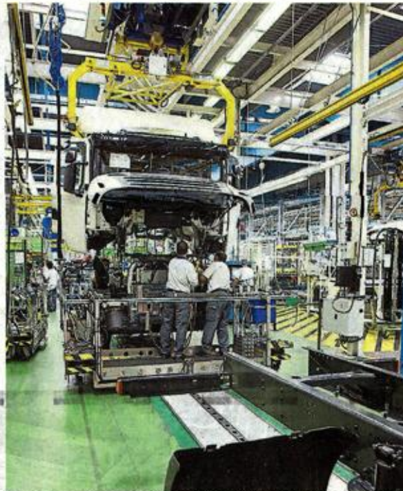
Scania France, qui a son siège à Angers, réalise 473 millions d'euros de chiffre d'affaires et occupe la quatrième place de notre palmarès des entreprises du département.

Sans nier les difficultés liées à la crise économique et sa cohorte de liquidations et de licenciements, force est de constater que l'économie angevine a encore de beaux joyaux dans sa corbeille. Le département est riche d'entreprises qui innovent, se développent et font connaître le Maine-et-Loire bien au-delà des frontières hexagonales. C'est avec la volonté affichée de les faire mieux connaître que nous avons conçu le tour d'horizon de l'économie angevine que propose ce supplément. Il permet de prendre le pouls des cinq grands secteurs économiques : industrie,