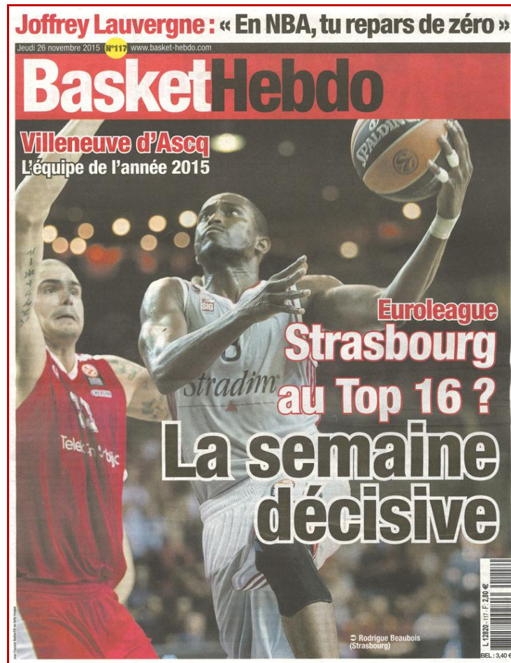
Basket Hebdo n°117 – Jeudi 26 novembre 2015