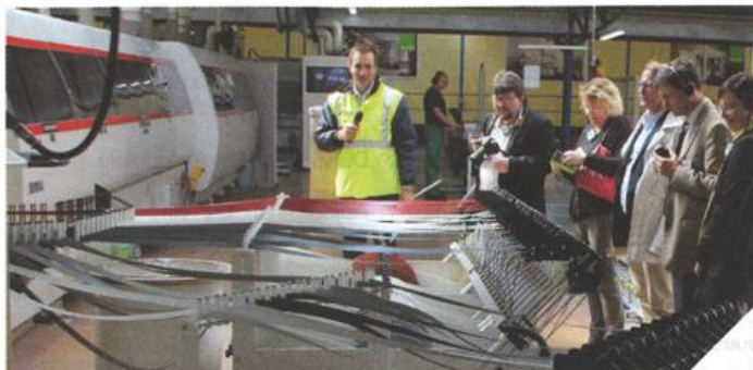
Longue de 70 mètres la nouvelle ligne de production permet de fabriquer 4500 pièces par jour.

Et les résultats sont probants, alors que sur les anciennes machines, il fallait compter plusieurs heures