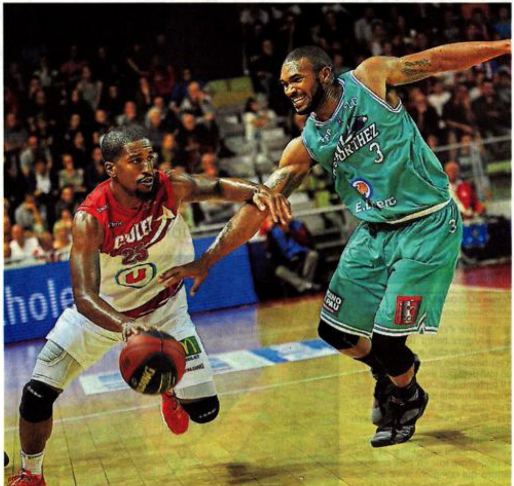
Cholet, La Meillerie, hier. Malgré l'activité de Goods (13 points), les Choletais se sont inclinés pour la première fois de la saison.

Un premier quart-temps presque trop bon, puis 30 minutes franchement décevantes : l'irrégularité choletaise s'explique sans doute par une certaine fatigue, 4 jours après le match à Villeurbanne, mais plus sûrement par un relâchement né des deux victoires obtenues en ouverture de championnat. « Oui, c'est possible, qu'inconsciemment, les félicitations reçues ces derniers jours aient eu un impact, même si j'avais pourtant insisté sur la nécessité de rester prudent. » « On l'avait répété toute la semaine, qu'il ne fallait pas tomber dans ce piège-là », renchérit Stephen Brun. « J'avais dit que Pau, ça serait plus dur que Villeurbanne, et qu'il ne fallait pas se croire arrivé après seulement deux